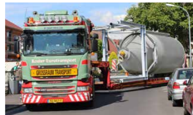
Antransport in einem Stück